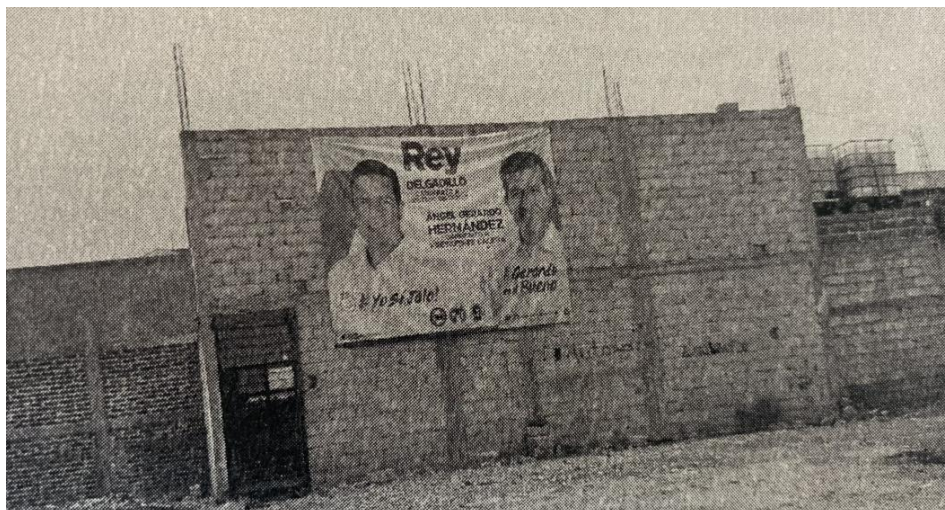
Imagen certificada correspondiente al Anexo I .

En lo que corresponde a la imagen del Anexo I , de la propaganda encontrada en el domicilio calle Fresnillo a espalda de la rosticería el pastor, entre calles 5 de Mayo y Calle Tránsito.