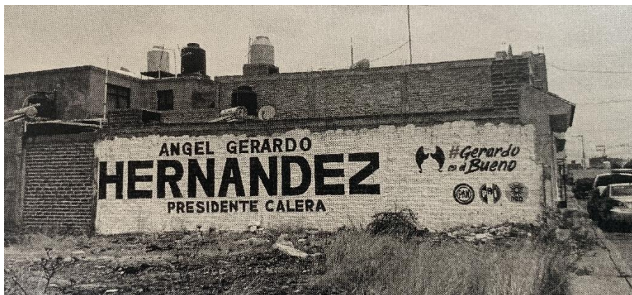
Imagen certificada correspondiente al Anexo III, 2.