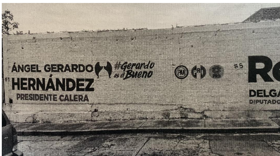
Imagen certificada correspondiente al Anexo V, 2.

En lo que corresponde a las imágenes del Anexo V , "C. Luis Moya entre calles Morelos y Matamoros." Al respecto informó que entre calles Morelos y Matamoros existe la Calle Ocampo, por lo que se anexan dos fotografías correspondientes; la primera, a la Calle Luis Moya entre Morelos y Ocampo y la otra, en calle Luis Moya, entre calles Morelos y Matamoros.