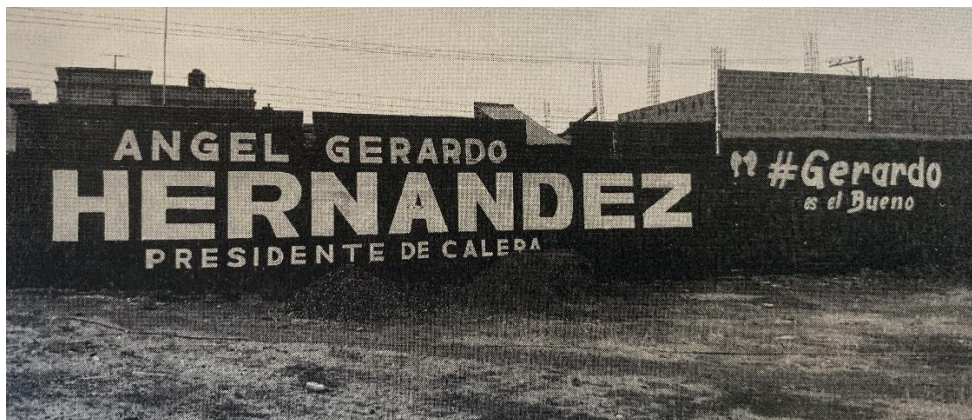
Imagen certificada correspondiente al Anexo IV, 2.