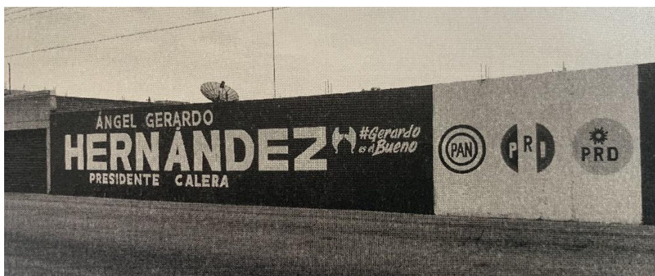
Imagen certificada correspondiente al Anexo IV, 2.