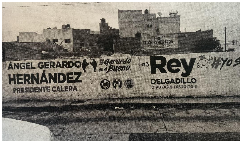
Imagen certificada correspondiente al Anexo V, 1.

Siendo todo lo que se puede percibir a simple vista de las imágenes certificadas en razón de la calidad fotográfica.